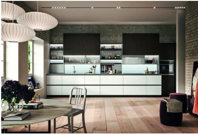
Il modello Link di Snaidero