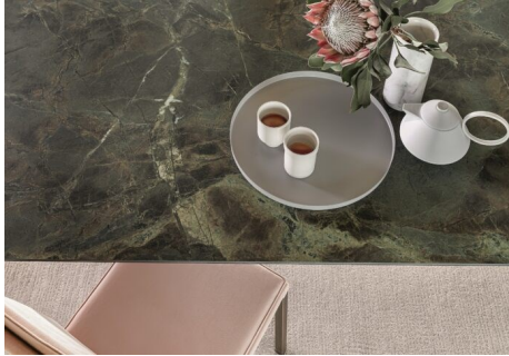
caffè più ambrato foglia - g

La casa come un'opera d'arte che racconta la personalità e la cultura della persona che la abita. Per il 2023 le tendenze dell'arredo puntano sull'eleganza combinata alla sostenibilità, con scelta di materiali ecologici e innovativi che richiamano il mondo naturale, incorniciato e impreziosito da finiture metalliche. Per scoprire le novità del design torna alla Fiera di Roma, dal 18 al 26 marzo, l'appuntamento con Casaidea, la manifestazione dell'abitare organizzata da Moa Società Cooperativa . In mostra per nove giorni le migliori soluzioni del settore, proposte